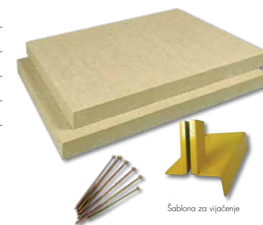
Šablona za vijachenje

Izjava o lastnostih (DoP) R4309 GPCPR Oznaka po SIST EN: MW-EN 13162-TS-DS(TH)-CS10(70)-TR15-PL(S)650-WS-MU1