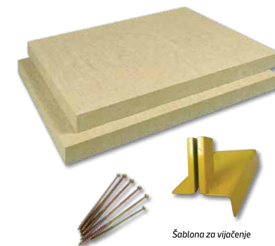
Šablona za vijačenje