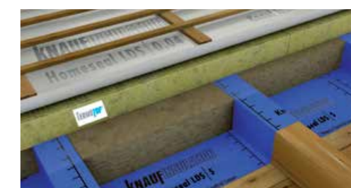
Skica 1 predstavlja edinstveno opcijo sanacije z zgornje strani, brez poseganja v bivalni prostor.

V praksi se največkrat srečamo z dvema primeroma.